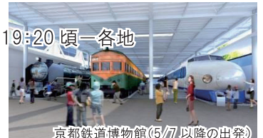
京都鉄道博物館(5/7 以降の出発)